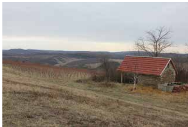
6. kép Felújított kőkunyhó a Mész-hegy tetején

A bükkaljai borospincék közül a legegyszerűbbek és legrégebbiek az épület nélküli lyukpincék, földalatti járatok: az 5–10 méter mély pinceágba egy keskeny folyosó (esetenként lépcső), a torok vezet le. Az ilyen torokpincék általában a lakótelkekhez