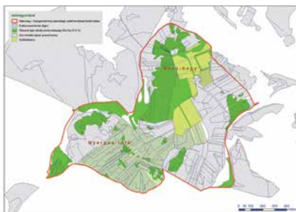
2. kép A védett természeti terület

irányított – majorsági szőlőbirtokok is kialakultak a szőlőhegyeken (így Eger határában is). A földesúr elismerte a hegyközségek önállóságát, a demokratikusan megválasztott választott tisztségviselők igazgatási szerepét: viszonyukat az egymásra utaltság, a közös érdek, a szőlő organikus művelése határozta meg.