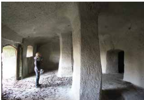
9. kép A Mész-hegy északi aljában, az Afrika-dűlő szélén található dézsmapince a földesúri birtoklás emléke