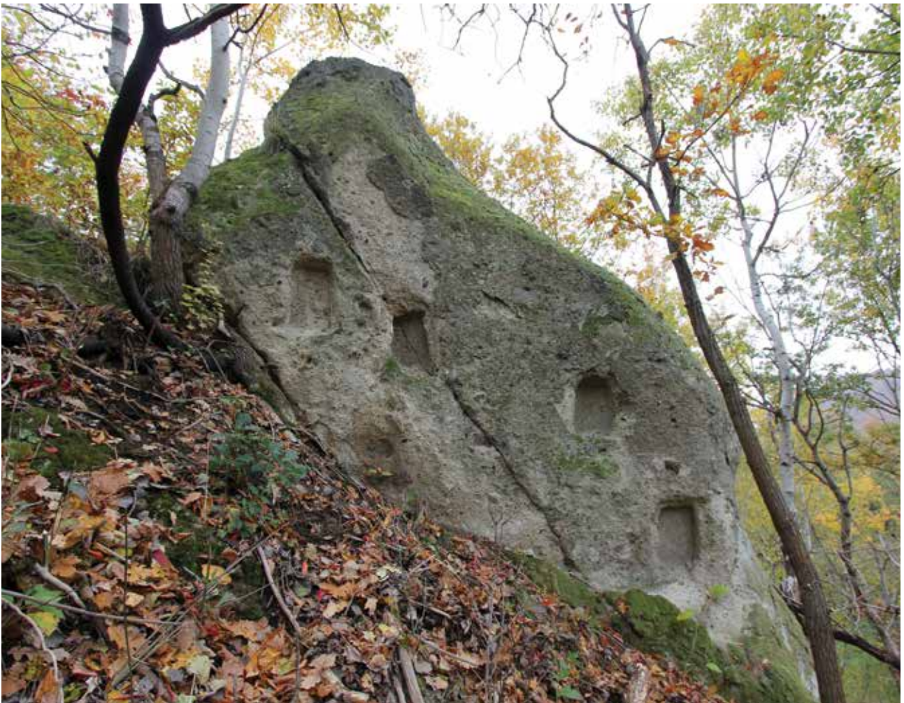
10. kép A Nyerges-tető keleti kaptárköve (H2d) (fotó: Baráz Csaba)

A hagyományos (szerves) tájművelés és a kőkultúra elemei közötti kapcsolat, a Bükkalja társadalomdinamikájának feltárása 16 tájelemek, gazdálkodási struktúrák felmérésének folytatása, kezelési terv elkészítése sürgető feladatunk.