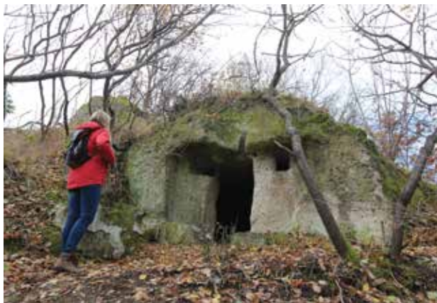
7. kép Egy riolittufába faragott hajlék (bújó) a Nyerges-tető északnyugati oldalán

A Mész-hegy – Nyerges-tető helyi jelentőségű védett természeti területen található három kaptárkő-csoport, valamint a bükkaljai kőkultúra egyéb elemei (bújók, pincék, kutak-források, kőfejtők, kőgarádok) és a hajdani szőlőhegyi tájművelés emlékei (régie gyümölcsfák, ősi fajták, sövények, parcellák, utak) egy feltárandó, rekonstruálendő és megővendő hagyományos tájstruktúra töredékei.