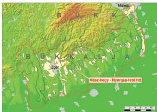
1. kép Bükkalja. A Mész-hegy – Nyerges-tető helyi jelentőségű védett természeti terület (Szőlőskepuszta hajdani promontórium) elhelyezkedése a II. katonai felmérésen ábrázolt szőlőterületekkel

ritkábban síkságon fekvő nagyobb összefüggő szőlőterület, amely egy vagy több helység szőlőbirtokosainak közös érdekvédelem alatt álló tulajdona. A síksági (Duna–Tisza köze) szőlők szőlőhegy elnevezése valószínűleg korábbi egységes jogi szervezetből ered ... A szőlőhegy a szőlőművelés színtere, így a szőlőmunkákkal kapcsolatos objektumok található rajta: a meredek lejtőkön szabálytalan kövekből, kötőanyag nélkül falazott teraszok, kőgátak, vízelvezető árkok és gödrök, a rétegvonalakkal párhuzamosan futó dűlőutak, kocsifordulók (szüretelőhely). A szőlőhegyek általában kerítettek. A kerítés egyszerű formája keskeny, feltöretlen bozotos földcsík, gyeperő, ami az egyes tulajdonosok szőlőföldjének határát is adja ...”