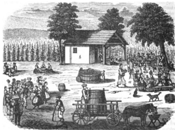
5. kép Az egri szüret ábrázolása a 19. század közepén (KUBINYI Ferenc – VAHOT Imre (szerk.): Magyarország és Erdély képekben IV. Pest, 1854. 72. oldal)

Míg a Dunántúlon tehát a szőlőben, a szőlőhegyen történt a szőlőfeldolgozás és a bortárolás is, azaz a szőlőterületen állnak a gazdasági épületek is (prэшáz, pince), 9 addig az Észak-magyarországi-középhegység vidékén a bortároló helyeket nem a szőlőben alakították ki, hanem a településről a szőlőbe vezető dűlőút mentén, leginkább a faluhoz közeli pincedombon, völgyben: ahol a pinceket csoportosan vágták a kőzetbe (pince-sor, pincecsoport, pincefalu). A bükkaljai szőlőhegyeken (pél-