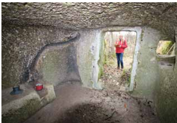
8. kép Klasszikus bújó belseje kályhával, füstelvezető járáttal