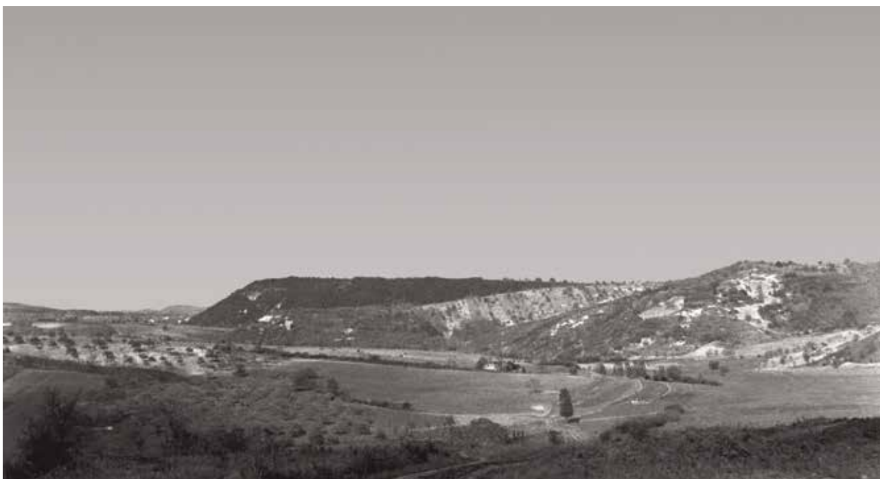
4. kép A Mész-hegy és a Nyerges-tető látképe délnyugat felől

amely főleg tömegtermelésre rendezkedett be. A nagyüzemi módszerek miatt a szőlőtermesztés lehúzódott a könnyebben