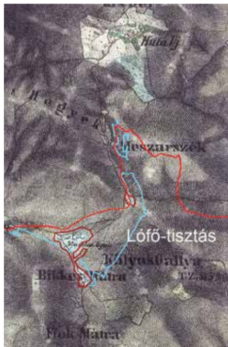
A Lófő-tisztás első megjelenítése a II. katonai felmérésen

A Lófő-tisztás és környéke a diósgyőri koronaadalom hajdani területén található. A közel 100 000 holdas diósgyőri koronaadalom 1514 óta kincstári birtok, amelyet királyi tulajdonosai többször elzálogosítottak. Első kiváltása 1702-ben történt, majd újra elzálogosították, végül 1755-ben az egri káptalantól végleg kiváltotta a szepesi magyar kamara 1 . Az úrbérrendezés tehát már kamarai irányítás alatt érte a diósgyőri uradalmat. (Az uradalom területének mintegy felét tették ki az erdőségek, amelyek Borsod vármegyében a Bükk hegység keleti részét foglalták el: az erdőbirtok kiterjedése a 19. század végi felmérések alapján 23 430 hektár, azaz 40 714,3 hold volt.) Az úrbérrendezés végrehajtására felszólító utasítás 1767 elején született meg. A diósgyőri uradalom szakosított erdőgazdálkodása az első vágásterv elkészülésével 1772-ben kezdődött meg. A kamarai irányítás alatt álló erdőbirtok már nem csak a tűzifa, illetve az építkezésekhez szükséges faanyag kitermelését szolgálta,