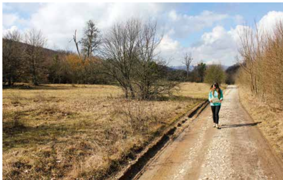
A Lófő-tisztás „magterülete” ma spontán cserjésedő, beerdősödő területe

A két világháború között tehát az állami erdőgazdaság a diósgyőri kincstári erdőben a legeltetést külön erre a célra kialakított és fenntartott legelőkre koncentráta. Kitisztították az erdei tisztásokat,