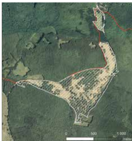
A Lófő-tisztás legnagyobb kiterjedése a 2005-ös légifelvételen vetítve