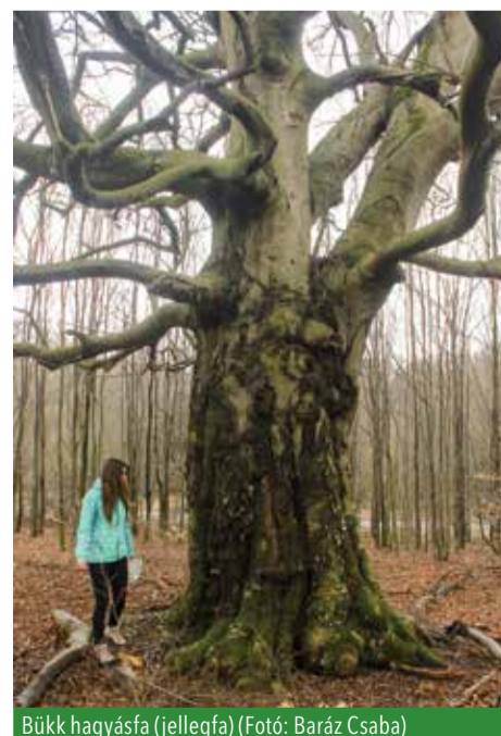
Bükk hagyásfa (jellegfa)