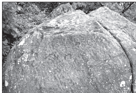
8. kép. Vésett felirat a Mátra-bércen (Baráz Cs.)