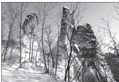
1. kép. A síroki Bálvány-kövek (Baráz Cs.)