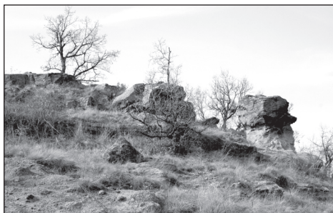
5. kép. Különleges alakú vulkáni formák a Felső-csevice fölötti hegytetőn (Kiss G.)

A „ csodakutakat ” gyógyító hatásuk és az ott megtörtént csodás események (gyógyulások, jelenések, látomások) miatt tartották nagy tiszteletben. Erre jó példa a fallóskúti Szent-kút . Ezek a csodatévő források, „szentkútak” gyakran válnak