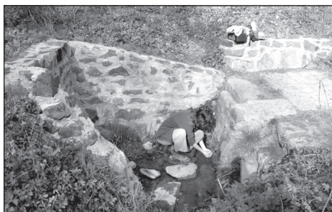
6. kép. A Felső-csevice (Kiss G.)

búcsújáró helyekké, mint azt Fallóskút példája is mutatja ( részletesen lásd később ).