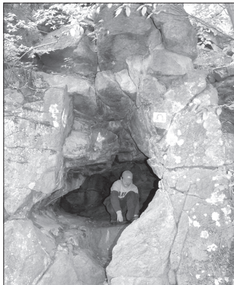
4. kép. Vidróczki (Zsivány)-barlang (Baráz Cs.)

A hegység másik „kincsrejtő barlangja” a Mát-rakeresztes közelében, andezit kőzetben nyíló Vidróczki (Zsivány)-barlang . (4. kép) A lábából felszabaduló gőzök, gázok által létrehozott hőlyagüreg a felszíni lepusztulás során bukkant elő a Malom-patak és az Ülés-patak közötti hegyhát oldalában (ESZTERHÁS I. 2006). A hosszúkás, lekerékített falú üreg hossza mindössze 5,1 méter, átlagmagassága 1,1 méter. A néphagyomány szerint Vidróczki Mártonnak volt a menedékhelye, kincseskamrája.