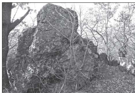
2. kép. A gyöngyössolyosi Bába-kő (Baráz Cs.)