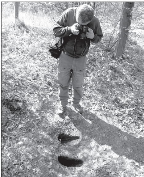
3. kép. A „török lábnyomos” szikla az Ágasvár alatt (Baráz Cs.)

A hegyekhez, sziklaalakzatokhoz képest általában – és különösen a Mátra esetében – kevesebb a negatív földfelszíni formához kapcsolódó „regélő helyek” száma. A pásztói (hasznosi) határban mélyülő Ördög-árok nevű völgy (az Ördög-kő közelében) sorolható ebbe a típusba.