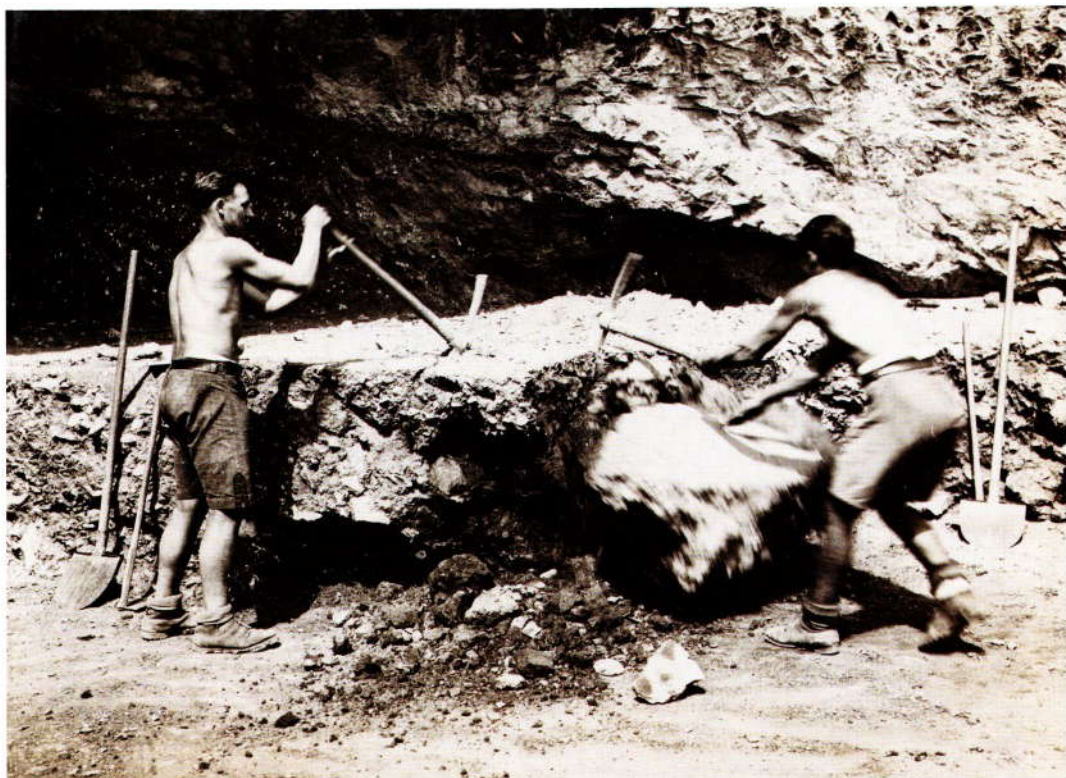
Fotó: Kovács József *

A NEANDER-VÖLGYI ÁLLKAPOCS ELŐKERÜLÉSÉNEK HELYE: a 11. négyzet III. szintje (fent)